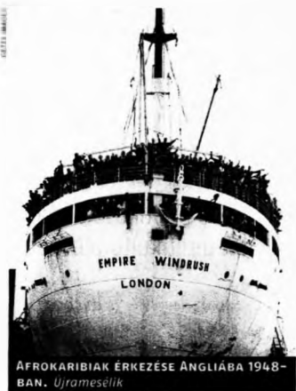
AFROKARIIBIAKI ÉRKEZÉSE ANGLIÁBA 1948-BAN. Ujraemlék

A nagy nemzetközi visszhangot kiváltó kijelentés négy évtizeddel az után hangzott el, hogy Pierre Trudeau liberális kormánya 1971-ben bejelentette: Kanada a világon elsőként multikulturális országgá válik. Vagyis az államnak nem célja az etnikai csoportok és a bevándorlók asszimilációja a többségi kultúrába, hanem minden, a területén tovább élő hagyományt a kanadai identitás egyenrangú részének tekint, és aktívan segíti a kisebbségi csoportokat nyelvük és kultúrájuk megőrzésében. Az eredeti elképzelésben szerepelt a különböző közösségek „termékeny találkozásának és tapasztalatcseréjének” elősegítése is a társadalmi egység fönntartása érdekében. Európában manapság ezt az elvet követik például azok a többnemzetiségű iskolák Bosznia-Hercegovinában, amelyek közös foglalkozásokon próbálják közelebb hozni egymáshoz a bosnyák és a horvát diákokat. A délszláv államban ugyanis több helyen máig szegregált oktatás folyik: a két etnikum a saját nyelvén, eltérő tananyagot tanul, nemegyszer ugyanabban az iskolaépületben.